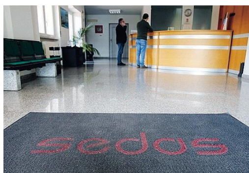
AZIENDA La Sedas Srl da quarant'anni affianca le imprese e i professionisti nel processo di Digital Transformation